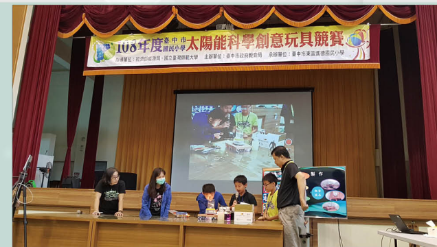
太陽能水龍捲創意競賽