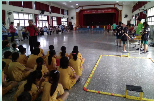
辦理臺中市節能創意機器人競賽及觀摩活動