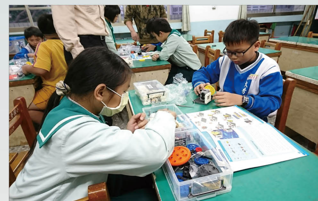
太陽能自走機器人設計課程