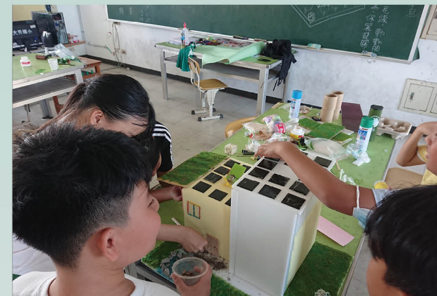
能源課程作品「我的節能屋」