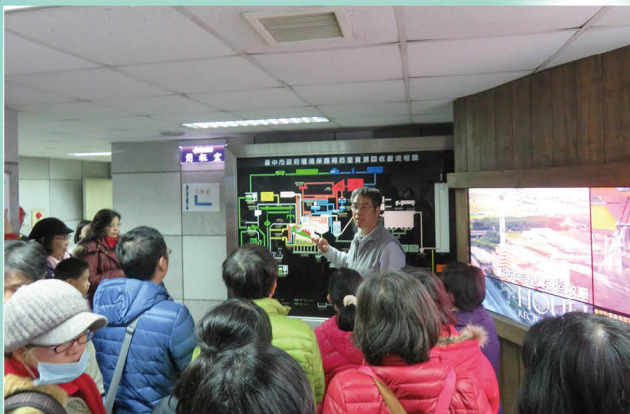
參訪臺中市后里資源回收場