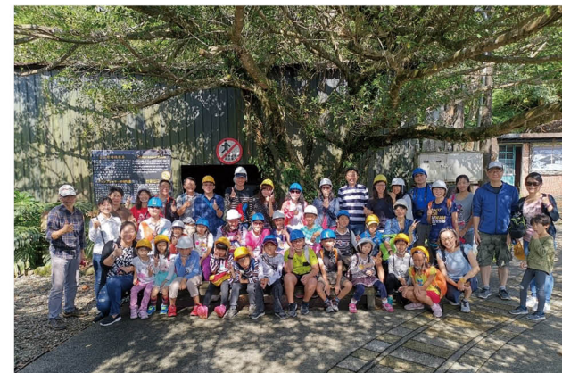
親子能源教育體驗參訪