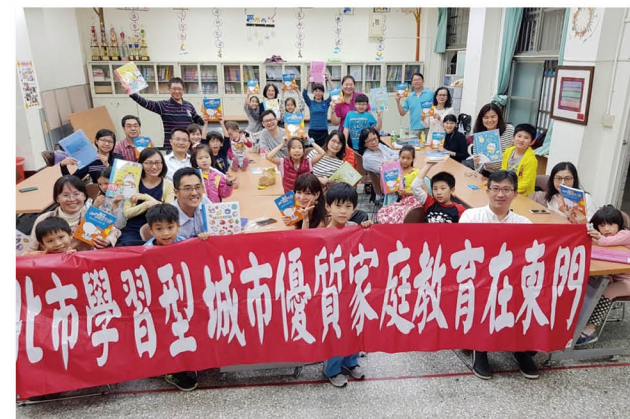
「地球的能源與生態危機」親子讀書會