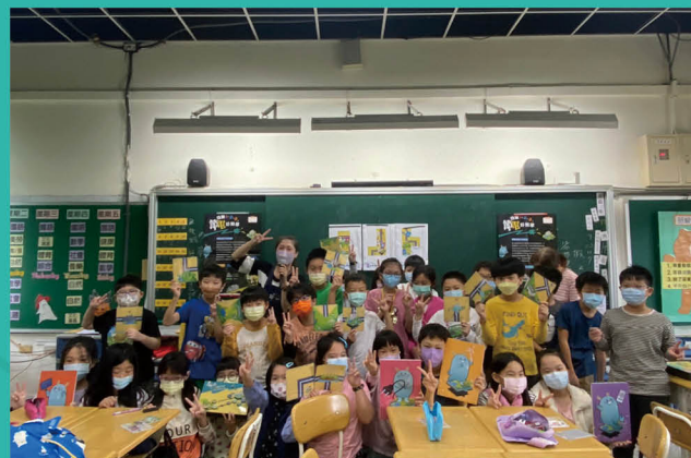
「改變 123·節電好簡單」專題演講