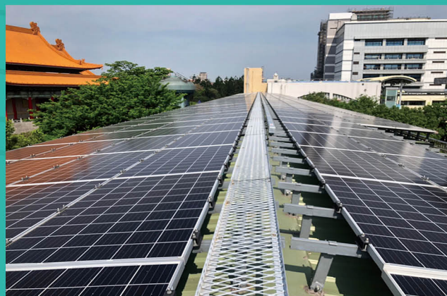
屋頂太陽能光電系統

辦理「小小說書人」說故事比賽，結合小劇場多元化形式呈現，提升學生認同節約能源理念。