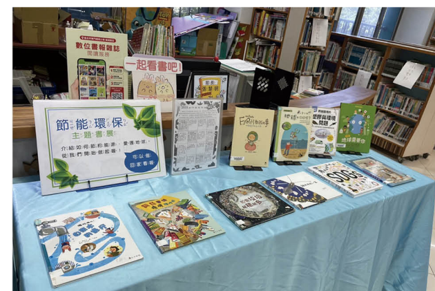
節能環保主題書展