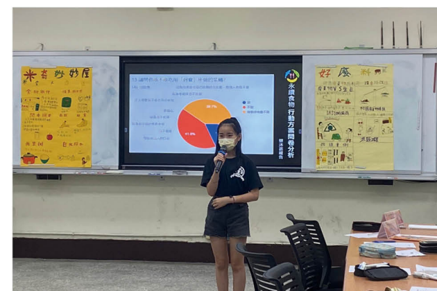
學生提出節能實際行動方案