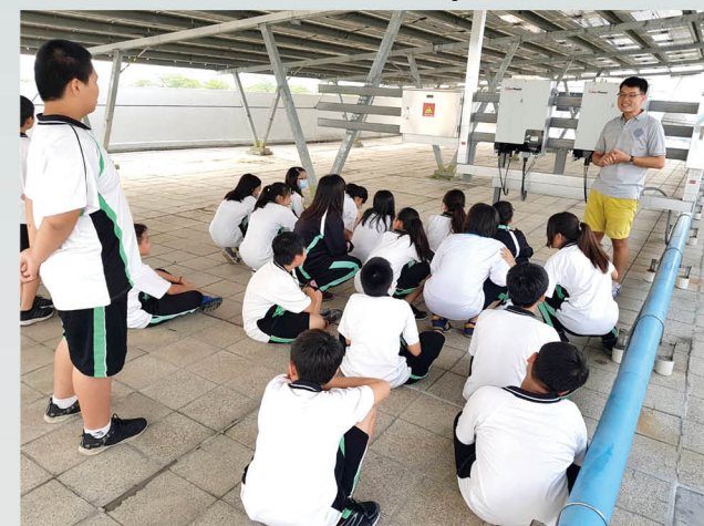
太陽能設備課程教學