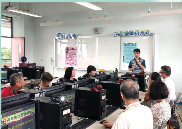
社區電腦營宣導太陽能光電 APP