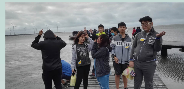
參訪高美濕地風力發電設施