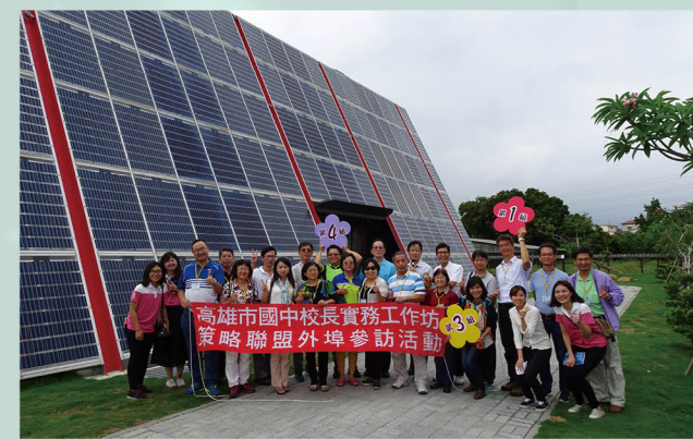
參訪太陽能光電設施